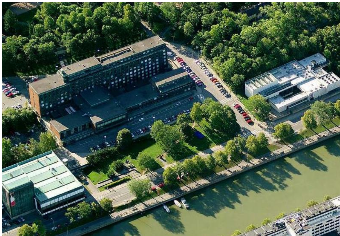
SISÄILMAPAJA 6 19.-20.11.2014 Turku