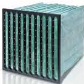
CITY-FLO XL -yhdistelmäsuodatin

CITY M HEPA H13 ja aktiivihiili- suodatuksella